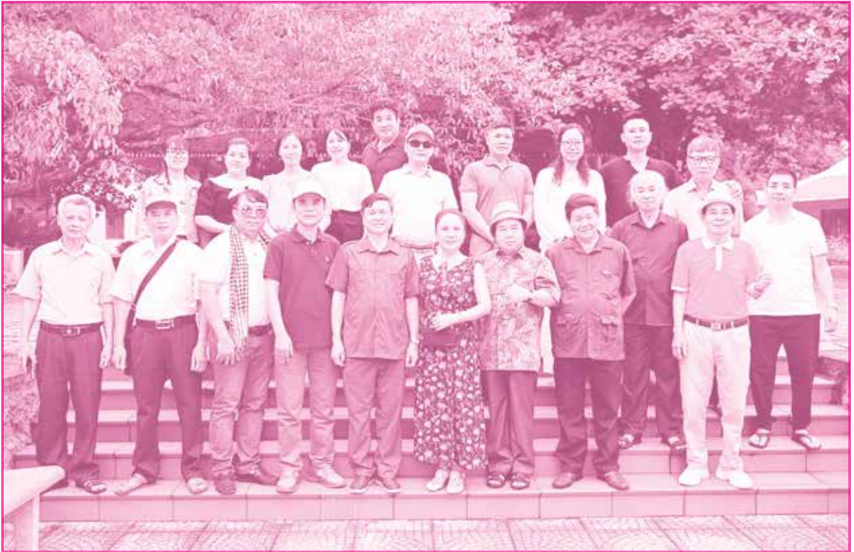
Đoàn VNS Bắc Ninh chụp ảnh tại Khu lưu niệm Chủ tịch Hồ Chí Minh trên đảo Quan Lạn

phía biển, hai bên là hai hàng phi lao xanh tốt. Biển cả đã hiện ra trước mắt chúng tôi dưới bầu trời xanh trong như một bức tranh thiên nhiên tuyệt hảo nhất mà trước giờ tôi chưa từng thấy. Từng đợt sóng ào ạt xô bờ, mới nhìn thôi đã đủ thấy niềm thích thú trong mắt mỗi người nổi khát khao được đến với biển. Chúng tôi đắm mình vào những cơn sóng trắng, vui vẻ, đùa giỡn... Cảm xúc lúc này đây đúng như câu mọi người thường hay nói: “Cho tôi xin một vé trở về tuổi thơ”. Sau một hồi thưởng thức sự mặn mòi, sôi động của biển khơi, chúng tôi về phòng nghỉ chuẩn bị ăn tối và chương trình biểu diễn giao lưu văn nghệ với bà con nơi đây. Địa điểm biểu diễn là